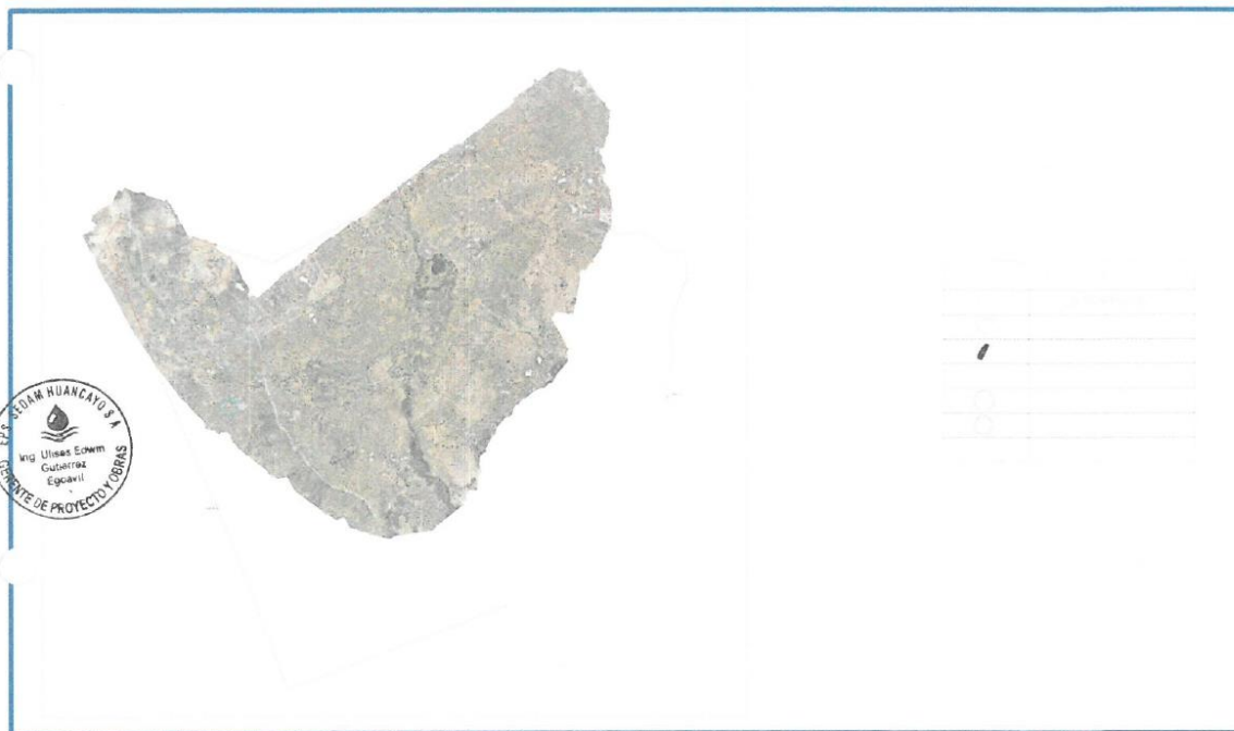
Plano de planteamiento general

Se llevará a cabo el mantenimiento de 4 km de vía mediante trabajos de bacheo, empleando una retroexcavadora en modalidad de máquina húmeda. Las actividades contemplan la identificación y evaluación de las áreas afectadas, la limpieza y preparación del terreno, el relleno con material adecuado y su compactación para garantizar la estabilidad y durabilidad de la vía. Esta intervención mejorará la transitabilidad del acceso a la zona de intervención, optimizando las condiciones de desplazamiento y reduciendo riesgos operacionales.