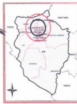
UBICACIÓN EN EL DISTRITO DE SAN JUAN BAUTISTA