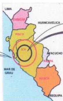
UBICACIÓN EN LA REGIÓN ICA