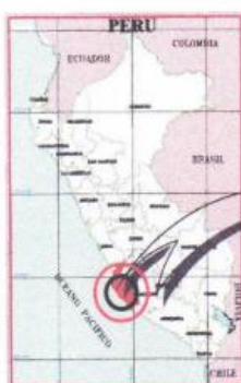
UBICACIÓN EN EL PERÚ

El proyecto "CREACION DEL SERVICIO DE TRANSITABILIDAD VIAL INTERURBANA EN PUENTE CARROZABLE DE CONCRETO DE CENTRO POBLADO EL OLIVO DISTRITO DE SAN JUAN BAUTISTA DE LA PROVINCIA DE ICA DEL DEPARTAMENTO DE ICA", CON CUI N° 2589592, se ubica en el centro Poblado El Olivo, del Distrito de San Juan Bautista – Ica – Ica.