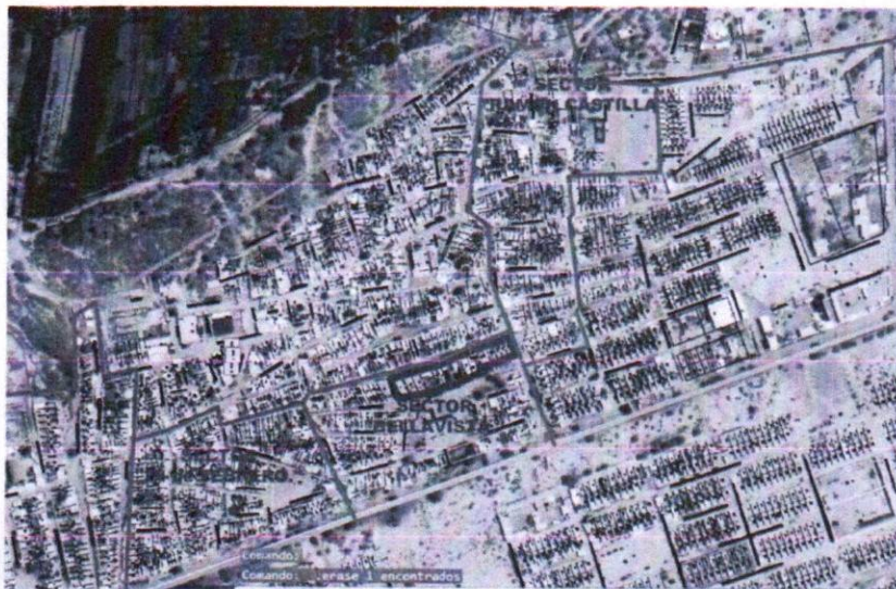
Figura N° 04: Mapa del Centro Poblado de Jibito

La propuesta, ha considerado la normativa general – RNE y los parámetros urbanísticos y edificatorios de la localidad para lograr una propuesta de solución que cumpla con los requerimientos y estándares que el sector requiere.