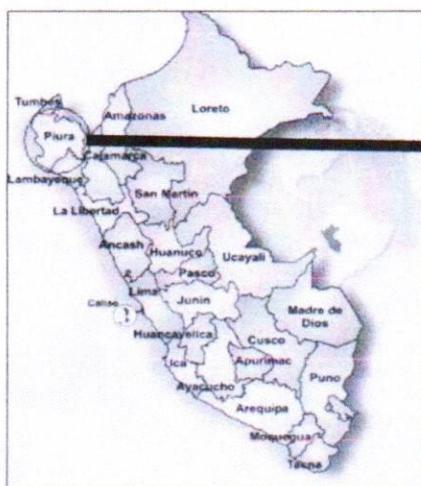
Figura N° 01: Mapa de la Departamento de Piura

Norte : Con la Hacienda La Capilla de Sullana Sur : Con la quebrada del Soledad del distrito La Huaca Oeste : Río Chira Este : Piura