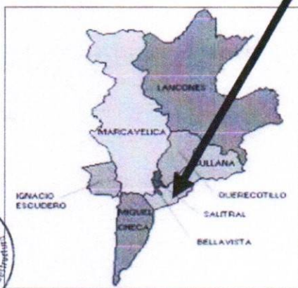
Figura N° 03: Mapa del Distrito de Miguel Checa