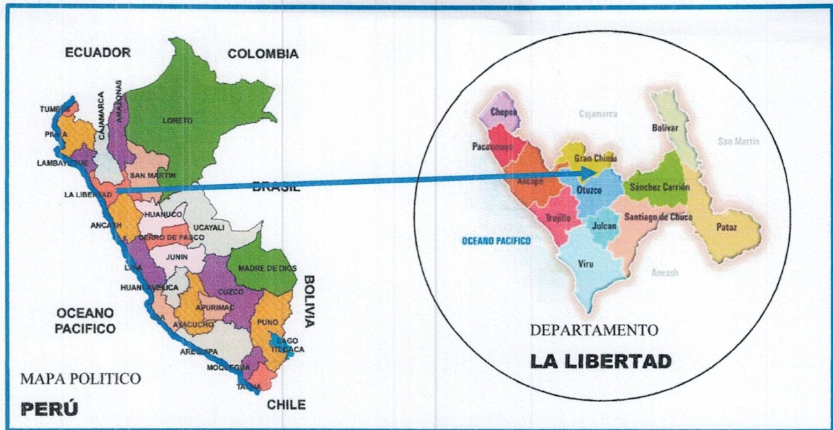
IMAGEN N°02. Mapa Político de la Provincia de Gran Chimú - La Libertad.