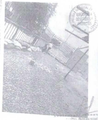
SITUACIÓN ACTUAL DE LA I.E INICIAL JESUS DE NAZARETH 1562, DEL DISTRITO DE TAMBOGRANDE.