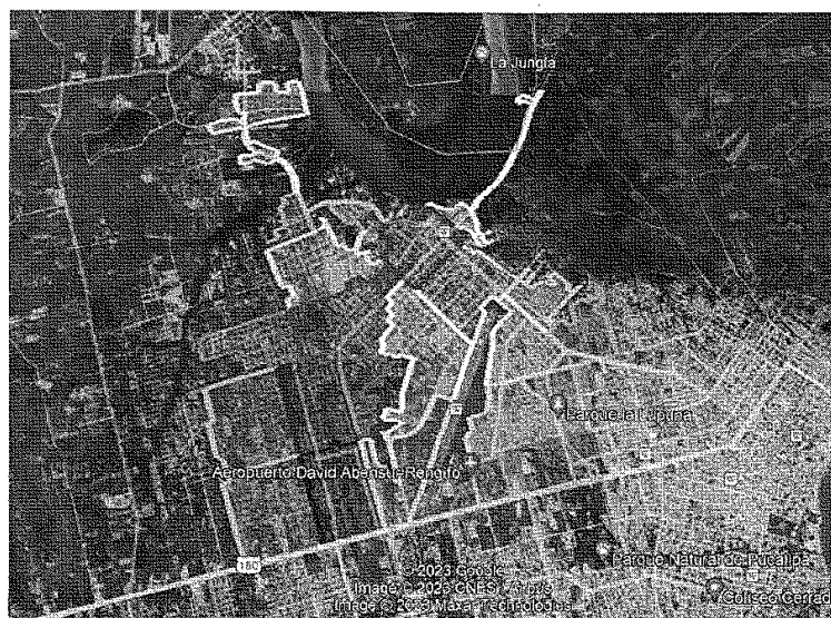
24 Zonas de recolección