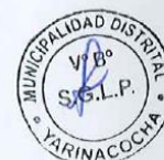
24 Zonas de recolección