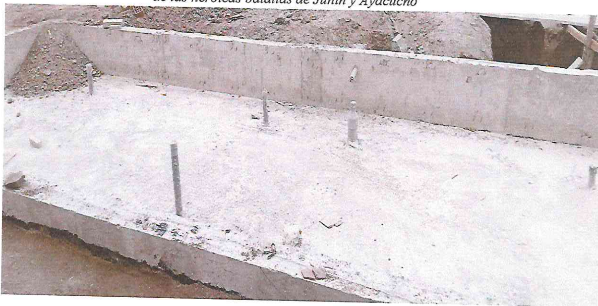
PISCINA PARA NIÑOS

“Año del Bicentenario, de la consolidación de nuestra Independencia, y de la conmemoración de las heroicas batallas de Junín y Ayacucho”