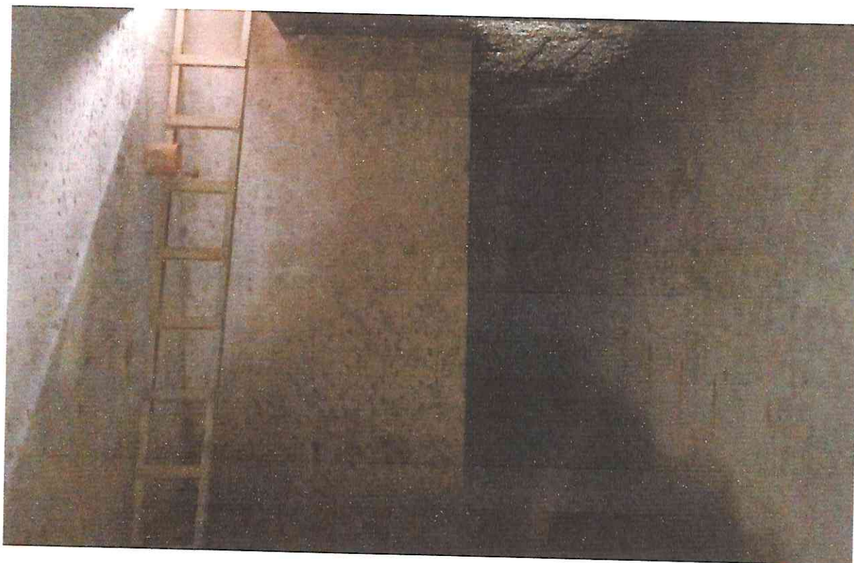
TANQUE DE COMPENSACION