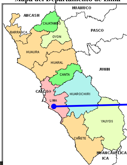
Mapa del Departamento de Lima