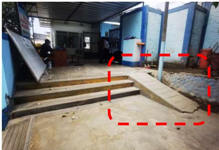
Fotografía N° 01.- Vista de Rampa N°01 cuenta con una rampa que no cumple con la normativa vigente, en cuanto a pendiente, barandas y dimensiones reglamentarias

Oficina de Gestión de la Educación Superior