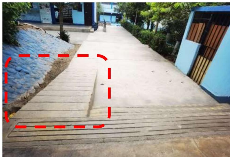
Fotografía N° 02.- Vista de Rampa N°01 cuenta con una rampa que no cumple con la normativa vigente, en cuanto a pendiente, barandas y dimensiones reglamentarias.