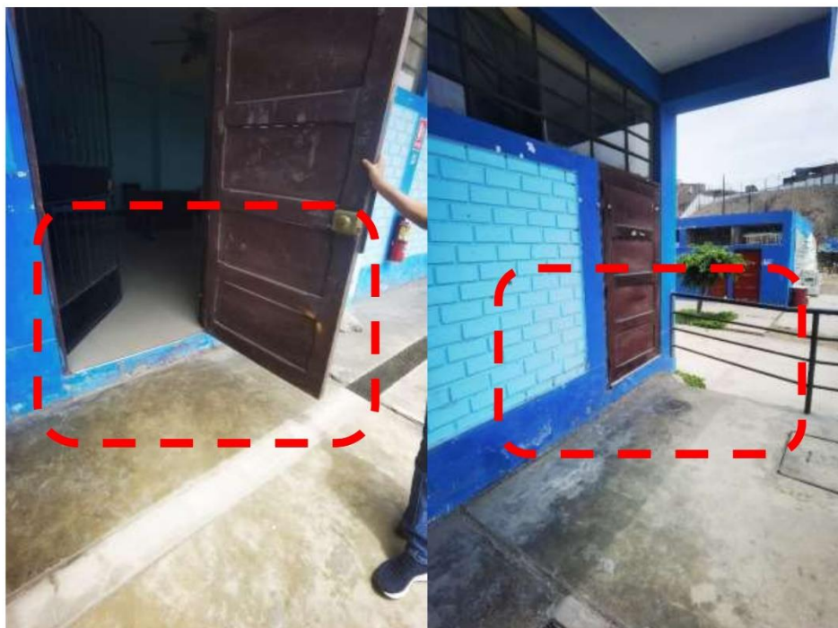
Fotografía N° 03.- Vista de Rampa N°02 y N°03 sin acceso de rampa peatonal hacia laboratorio con ingreso a desnivel, se propone una rampa con descanso.

Oficina de Gestión de la Educación Superior