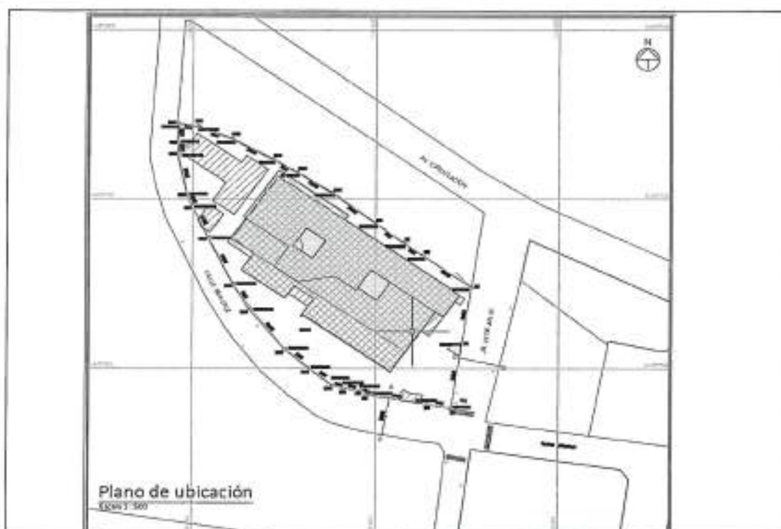
Fig. 2: Terreno de propiedad de la Municipalidad Provincial de Bolognesi, (Zonificación: Zona de Reglamentación Especial RDM).

Asimismo, dicho terreno cumple con las exigencias normativas como los parámetros urbanísticos establecidos por la municipalidad de la localidad, factibilidad de servicios básicos, el área requerida para el desarrollo de los servicios de salud, el tipo de suelo, facilidades de acceso, disponibilidad de materiales en la zona para la ejecución y condiciones para su traslado, así como las características de la topografía del terreno, peligros existentes, dimensiones ambientales que podrían afectarse, entre otras consideraciones establecidas en la normatividad del Sector Salud.