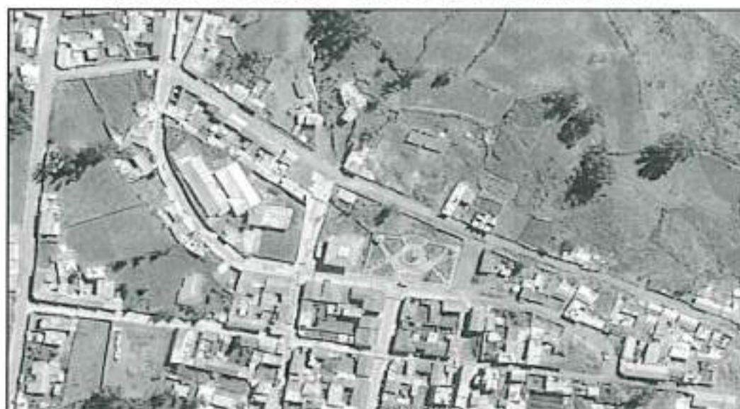
Fig. 3: Ubicación del Hospital en la Ciudad de Chiquian.