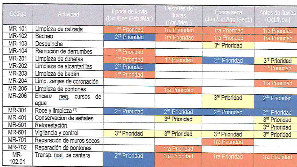
CUADRO 1: PRIORIDADES ESTABLECIDAS

De acuerdo a lo anterior, se distribuye las actividades a ser desarrolladas durante el año en el siguiente cuadro que indica las prioridades establecidas.