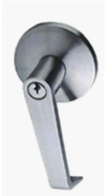
PALANCA DE FUNCION DE ENTRADA PARA DISPOSITIVOS DE SALIDA DE PANICO