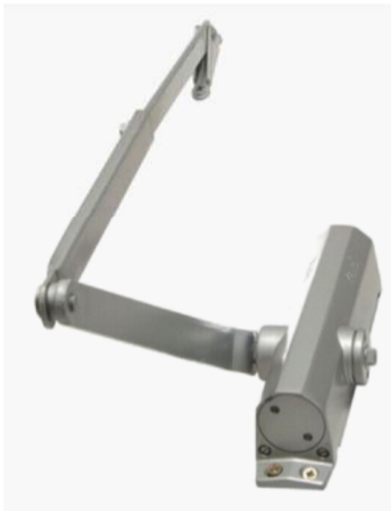
CIERRA PUERTAS HIDRAULICOS