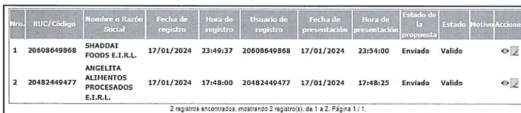
Imagen N° 01

Conforme a lo programado en el cronograma del procedimiento de selección, la presentación de ofertas (electrónica) se realizó el 17 de enero del 2024 (00:01 a 23:59 horas). Habiéndose cumplido dicho plazo, el comité de selección procede a verificar las ofertas presentadas a través del Sistema Electrónico de Contrataciones del Estado – SEACE, figurando lo siguiente: