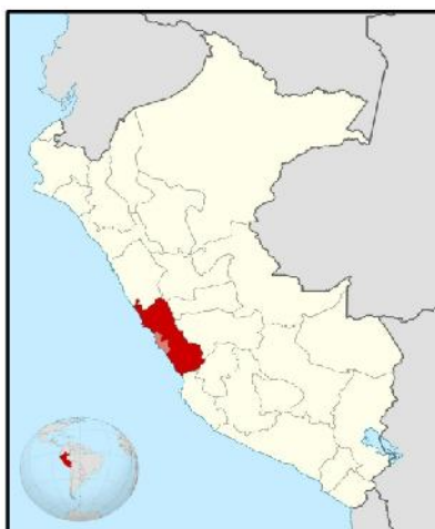
UBICACIÓN GEOGRÁFICA DEL DEPARTAMENTO DE LIMA

Región : Lima Departamento : Lima Provincia : Lima Distrito : Lince