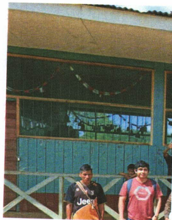
AULAS PEDAGOGICAS DE LA I.E. N° 65161 – B

Salón ubicado en el pabellón 01, tienen una infraestructura con paredes de madera, piso de madera suspendido sobre el suelo, ventanas de madera y techo de madera con cobertura de calaminas y cielo raso de madera machimbrada que en algunos sectores presenta humedad producto de las lluvias intensas, están pintadas las aulas. Pero el ambiente no es adecuado para el desarrollo de las labores estudiantiles. Los ambientes de esta institución se encuentran en mal estado