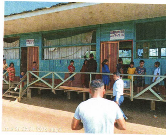
PABELLON DE LA I.E. N° 65135 – B

A continuación, se describe el pabellón 01 por ambiente: