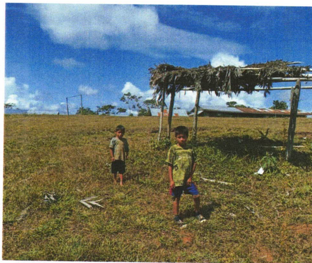
PATIO RECREATIVO. DE LA I.E. N° 65161-B

Los niños de la institución educativa cuentan con un patio recreativo con delimitación, siendo este el área natural.