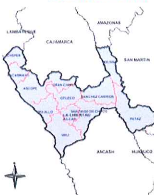
Ilustración 2: Mapa del departamento de La Libertad