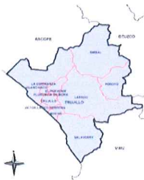
Ilustración 3: Mapa de la provincia de Trujillo