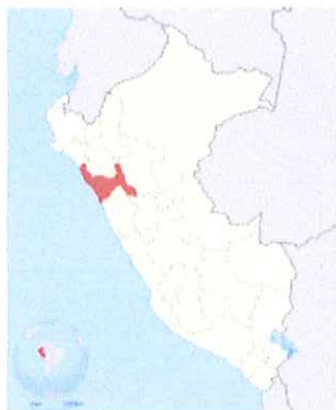
Ilustración 1: Mapa macro de la localización del Perú