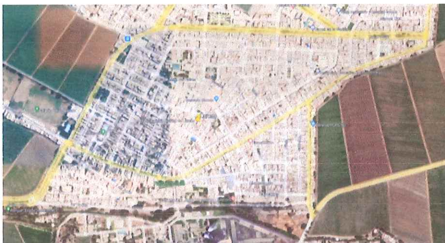
Ilustración 5: Distrito de Laredo