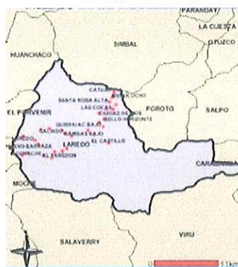
Ilustración 4: Mapa del distrito de Laredo