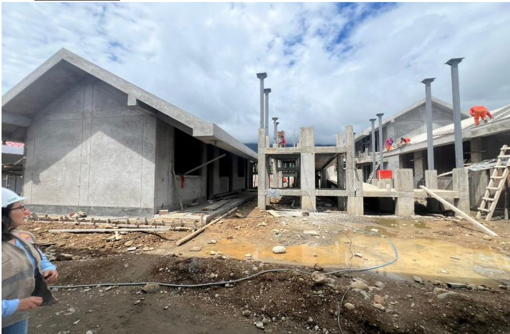
Fig. 01: Avance físico al 25 de diciembre del 2023