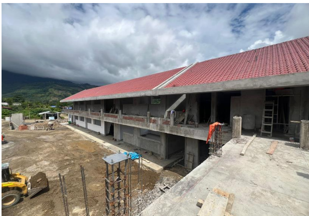
Fig. 01: Avance físico al 25 de Diciembre del 2023