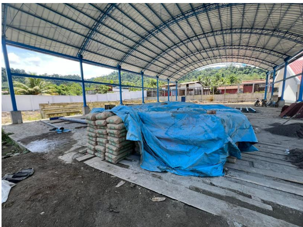
Fig. 01: Avance físico al 25 de Diciembre del 2023