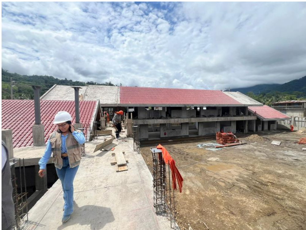
Fig. 01: Avance físico al 25 de Diciembre del 2023