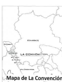
Mapa de La Convención

Jr. José Olaya 151 - 153 Plaza Mayor de la Pacificación Kimbiri - La Convención - Cusco / RUC: 20178199251