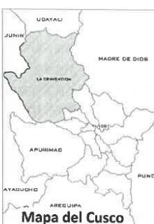
Mapa del Cusco