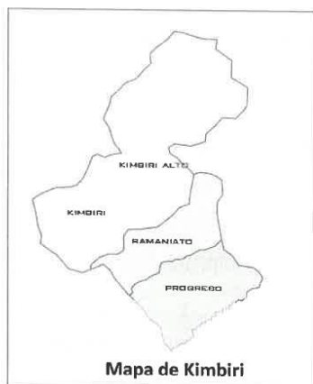
Mapa de Kimbiri