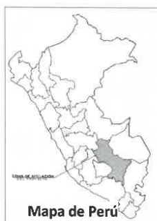
Mapa de Perú