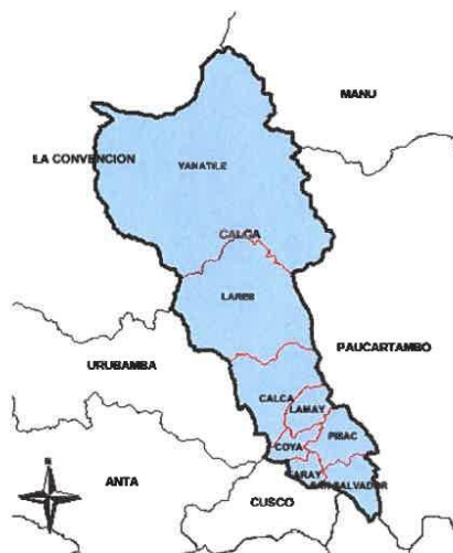
MAPA 02: Ubicación Geográfica Distrito de Yanatile

Es la contratación de un consultor, como persona natural o jurídica debidamente inscrito en el Registro Nacional de Proveedores, para la formulación del Expediente Técnico, del Proyecto de Inversión Pública denominado "MEJORAMIENTO DE LOS SERVICIOS DE SALUD DEL ESTABLECIMIENTO DE SALUD DE COMBAPATA, DEL DISTRITO DE YANATILE - PROVINCIA DE CALCA - DEPARTAMENTO DE CUSCO DE CUI N°2564976" en base a las NORMA TÉCNICA DE SALUD N° 113 – MINSA/DGIEM – V.01 de salud y normas legales y técnicas afines, de que las infraestructuras proyectadas cumplan con los criterios técnicos de funcionalidad, y de esta manera brinden servicios de calidad contribuyendo a un fin común el cierre de brechas en el sector salud.