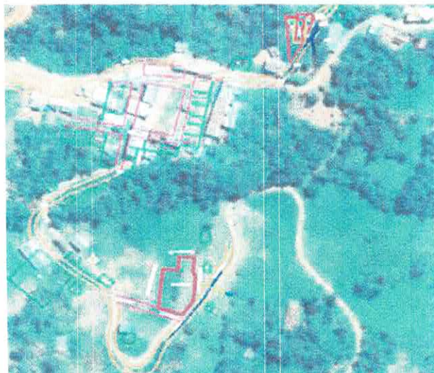
Mapa Micro Localización de la Institución Educativa de Nivel Inicial. I.E. N° 396 NARANJO YACU