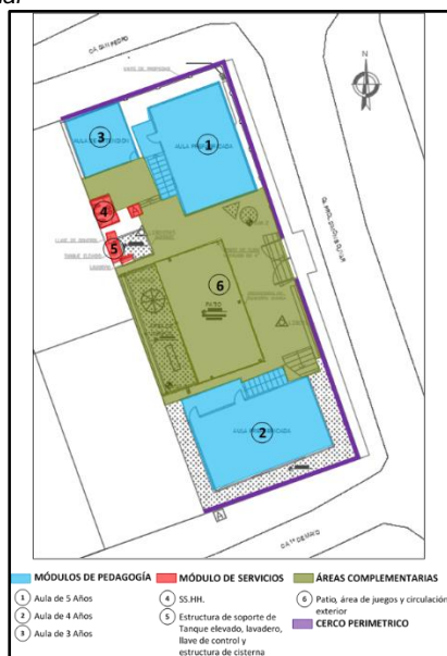
Imagen 02: Plano Situación Actual

La Institución Educativa cuenta con 5 módulos; detallando que el Módulo 1 y 2 son prefabricados, colocados por PRONIED en el año 2016, para un aula de 5 años y 4 años, dicha aula fue, dentro de este módulo se tienen áreas delimitadas: para los estudiantes de inicial, un área delimitada para Servicio Higiénico de niños los cuales cuentan con inodoros y lavamanos, y un almacén. El Módulo 3 es de madera el cual fue usado anteriormente como un almacén y actualmente condicionado para ser usado como aula para niños de 3 años, esta edificación prefabricada fue construida en 2017. El Módulo 4 fue construido en el 2019 de drywall son los servicios higiénicos y el módulo 5 es el tanque elevado y su estructura e instalación que provee de agua potable a la institución educativa.