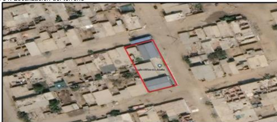
Imagen 01: Localización del terreno