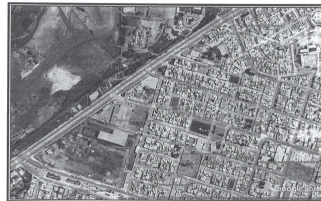
Imagen 01 - Vista satelital de la localización del proyecto (Resaltado en Rojo)