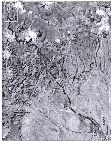
IMAGEN N° 01

Croquis Desde Tacna Hasta El C.P. Alto Perú: