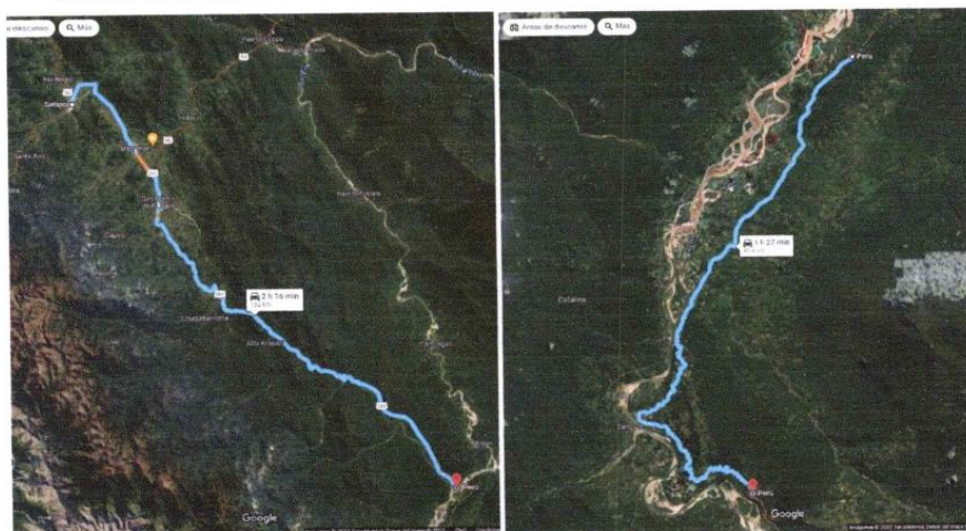
IMAGEN N°03: RUTA DE ACCESO

El financiamiento proviene del Sector Público, POR 07: FONDO DE COMPENSACION MUNICIPAL, garantizando la entidad de acuerdo con las bases, las condiciones de financiamiento, la misma que debe ser certificada por el área de presupuesto.