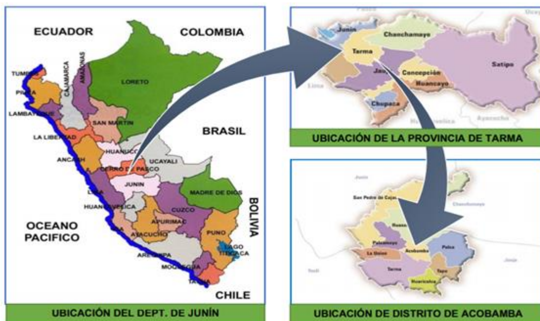
FIGURA 01: Ubicación Política del proyecto

Norte : 8744656.00 m S Altitud : 29235 msnm