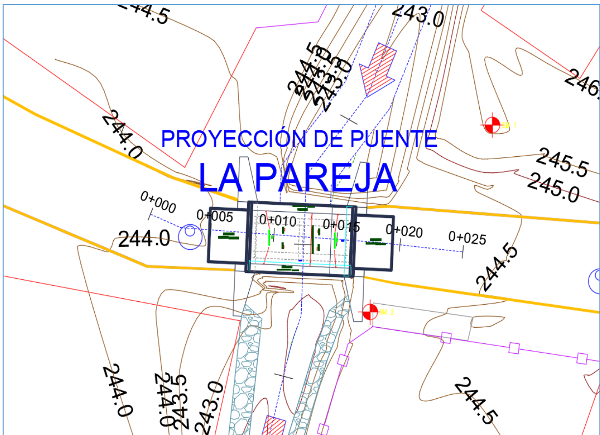
Imagen N°1: Vista en Planta de Puente (Fuente: Expediente técnico, Planos).