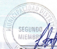
2do. Miembro Titular