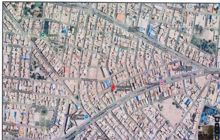
Ilustración 1: Ubicación de la I.E. (Maps)