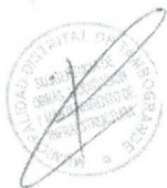
SITUACIÓN ACTUAL DE LA I.E. INICIAL JESUS DE NAZARETH 1562, DEL DISTRITO DE TAMBOGRANDE.