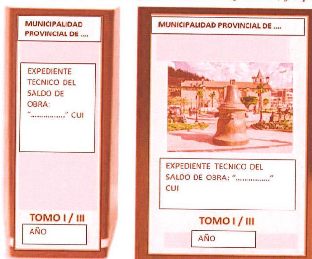
Figura 1. Forma de presentación del Expediente (ejemplo)

Cuando el expediente técnico de saldo de obra, fuera aprobado por el ministerio de vivienda, en su totalidad, ya debera presentado en archivadores. Cada archivador deberá considerar una carátula en la parte frontal y en lomo del mismo, para una rápida verificación. Se recomienda que dichas carátulas, deberán indicar como mínimo, lo indicado en la figura 1 (ejemplo modelo).