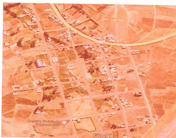
Mapa de Ubicación del centro poblado Pataccocha

La prestación será en la zona urbana del distrito de José María Arguedas, PROVINCIA DE ANDAHUAYLAS, DEPARTAMENTO DE APURÍMAC.