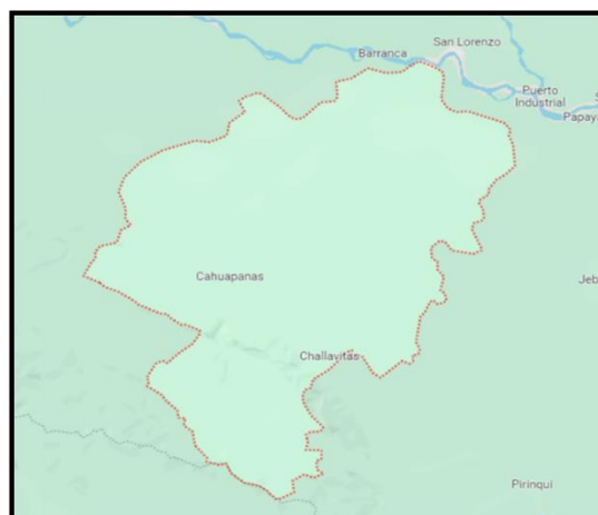
GRÁFICO N° 02: DISTRITO DE CAHUAPANAS