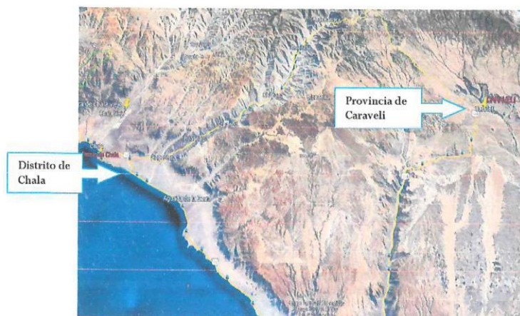
GRAFICO N° 03: Ubicación del Área Urbana - Vista de Google Earth.