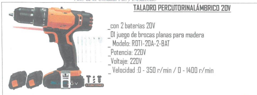
TALADRO PERCUTORINALÁMBRICO 20V