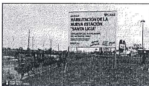
Imagen referencial N °04