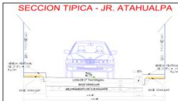
Detalle de Sección típica de las calles a intervenir