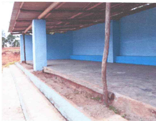
Fotografía N°07: Vista de escenario de la institución educativa

En este módulo está considerado el escenario, muros de adobe (0.30 x 0.30 m), en mal estado de conservación, techos de calamina apoyados en una estructura de madera y pisos de cemento pulido