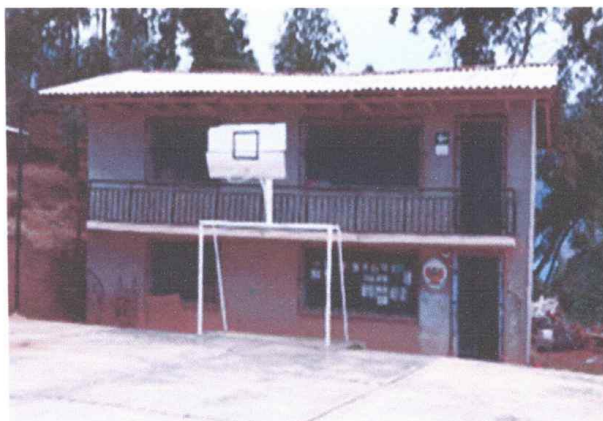
Fotografía N°04: Vista parte exterior del módulo N° 03

En el módulo 03, están ubicados la biblioteca, la dirección y un aula, de dos niveles, los muros son de adobe (0.30 x 0.30 m), en mal estado de conservación, techos de calamina apoyado en una estructura de madera y los pisos son de cemento pulido y se encuentran agrietados.