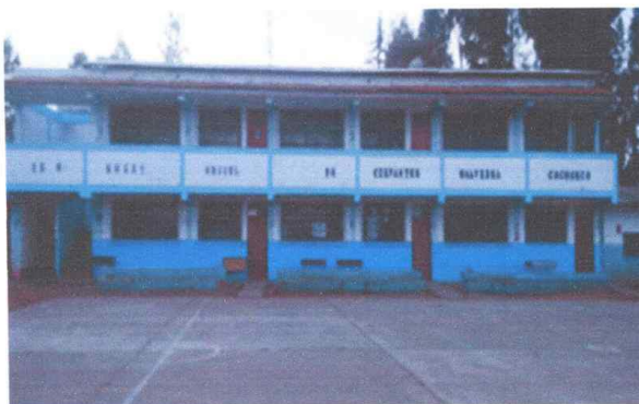
Fotografía N°06: Vista parte exterior de las aulas de primaria y secundaria en el módulo N° 04

Aulas de primaria y secundaria, de dos niveles, muros de albañilería asentado de soga tarrajado, columnas y vigas de concreto, techo de losa aligerada y los pisos son de cemento pulido.