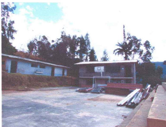
Fotografía N°08: Vista de losa deportiva

Asimismo, la organización de la institución educativa en general se desarrolla en torno a 2 patios generándose circulaciones pequeñas entre módulos, las cuales permiten que estos estén relacionados