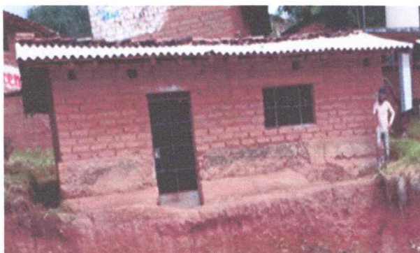
Fotografía N°02: Vista externa del almacén

En este módulo está ubicado el almacén, es de un nivel. Sus muros de adobe (0.30 x 0.30 m.), se encuentra en mal estado de conservación, techo de cobertura liviana apoyado en una estructura de madera y los pisos son de cemento pulido y se encuentran agrietados.