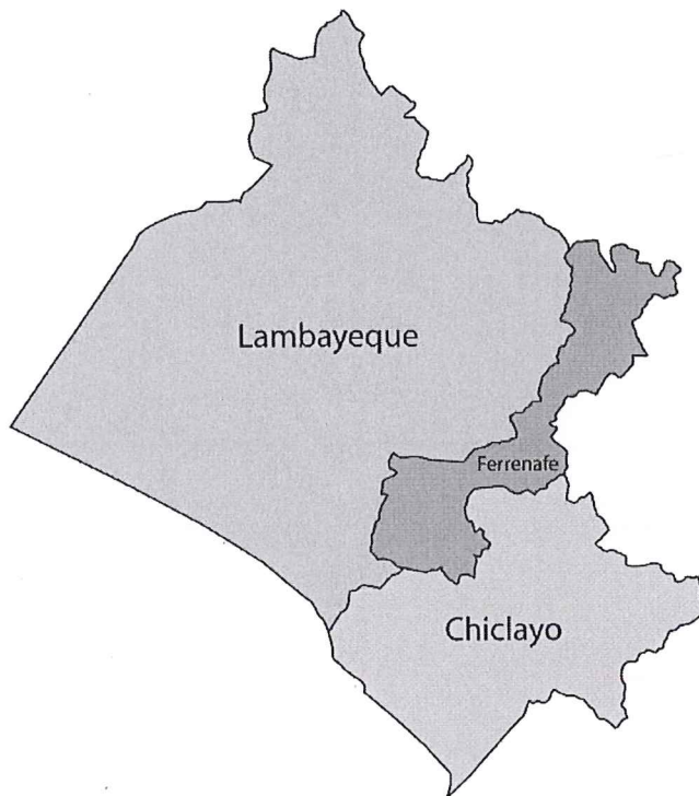
MAPA N° 03: UBICACIÓN DEL DISTRITO DE FERREÑAFE