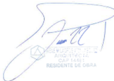
RESIDENTE DE OBRA