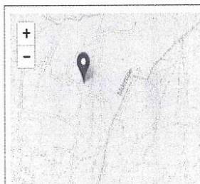
Imagen 01: Fuente ESCALE