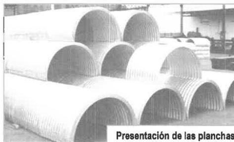
Presentación de las planchas semicirculares