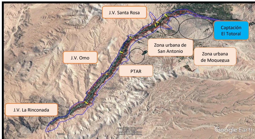
Ilustración 1: Mapa de ubicación del área de intervención del proyecto.

La ciudad de Moquegua, conocida como la “Capital del Cobre Peruano”, es la capital de la Provincia Mariscal Nieto y del Departamento de Moquegua. Se encuentra ubicada a 1410 msnm a orillas del Valle de Moquegua a 17°11’12’’ Latitud Sur y 70°56’06’’ Longitud Oeste.