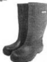
Bota de Jebe

Equipos de Protección Personal (EPPs) los cuales deberán ser reemplazados de acuerdo a la necesidad. En el caso de los cascos de protección estos deben cumplir con los requisitos de absorción de impacto y resistencia a la penetración el personal de mantenimiento deberá usar cascos de color anaranjado, mientras que de los jefes de mantenimiento deberá ser color azul.