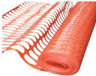
* Imagen Referencial