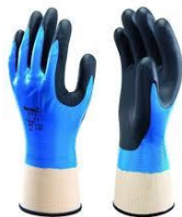
* Imagen Referencial

NORMAS : Debe cumplir la norma ANSI/ISEA 105-2005. – EN 388-2003(4121).