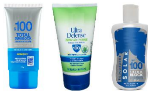
* Imagen Referencial

Norma : Debe cumplir la norma International Sun Protector factor test method 2006.