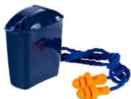
* Imagen Referencial

NORMAS : Debe cumplir la norma ANSI S3.19-1974.