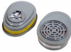
* Imagen Referencial

NORMAS : Debe cumplir y certificar la norma NIOSH 42CFR84. / OSHAS.