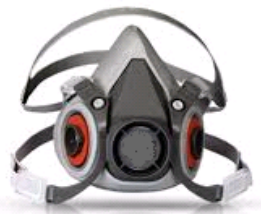
* Imagen Referencial

NORMAS : Debe cumplir la norma OSHA, certificación NIOSH 42CFR84. / OSHAS.