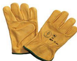
* Imagen Referencial

NORMAS : Debe cumplir la norma EN388:2016 - 3122.