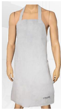
* Imagen Referencial