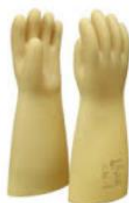
* Imagen Referencial

NORMAS : Debe cumplir la norma EN60903:2003 - CEI60903:2014. / EPI Categoría III (Reg.EU2016/425)