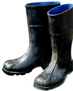
* Imagen Referencial

Norma: Debe cumplir con la norma NTP-ISO 20345 o equivalente.