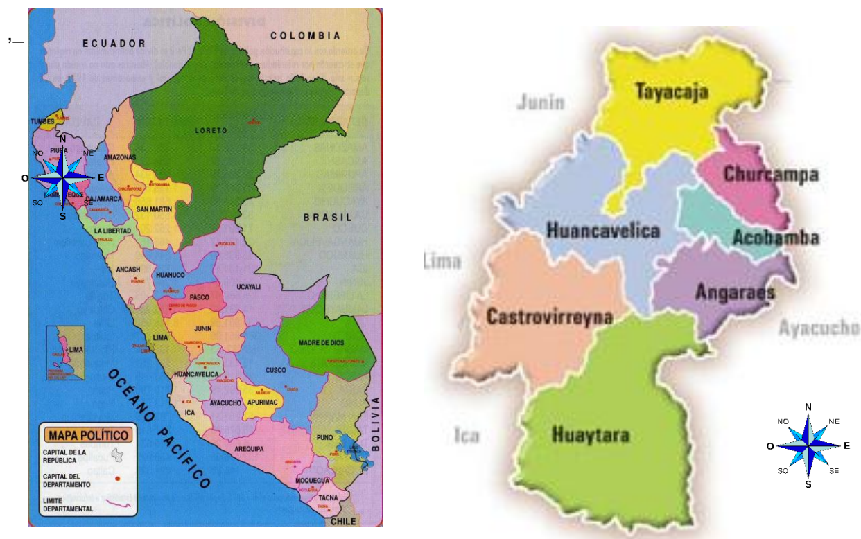
Figura 01 Macro Localización