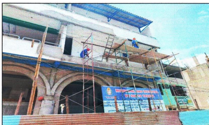
FOTO 02: VISTA DE ELEVACION DONDE SE UBICARÁ LA PANTALLA GIGANTE.