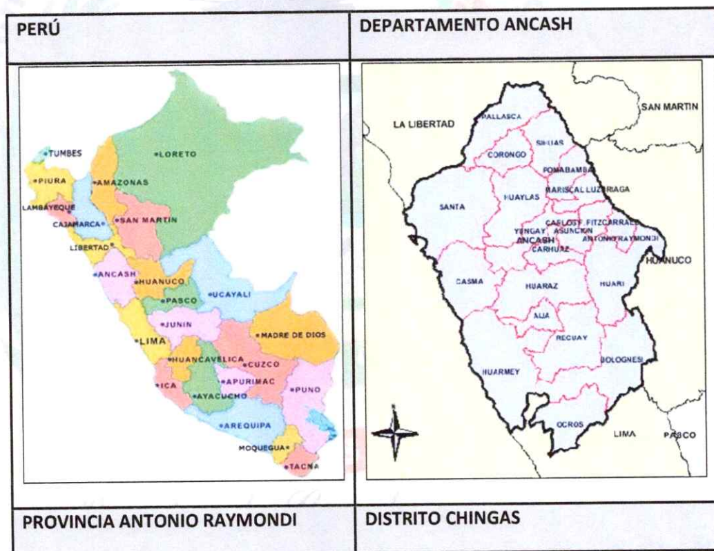
GRAFICO 01: Macro Localización del Distrito de Chingas