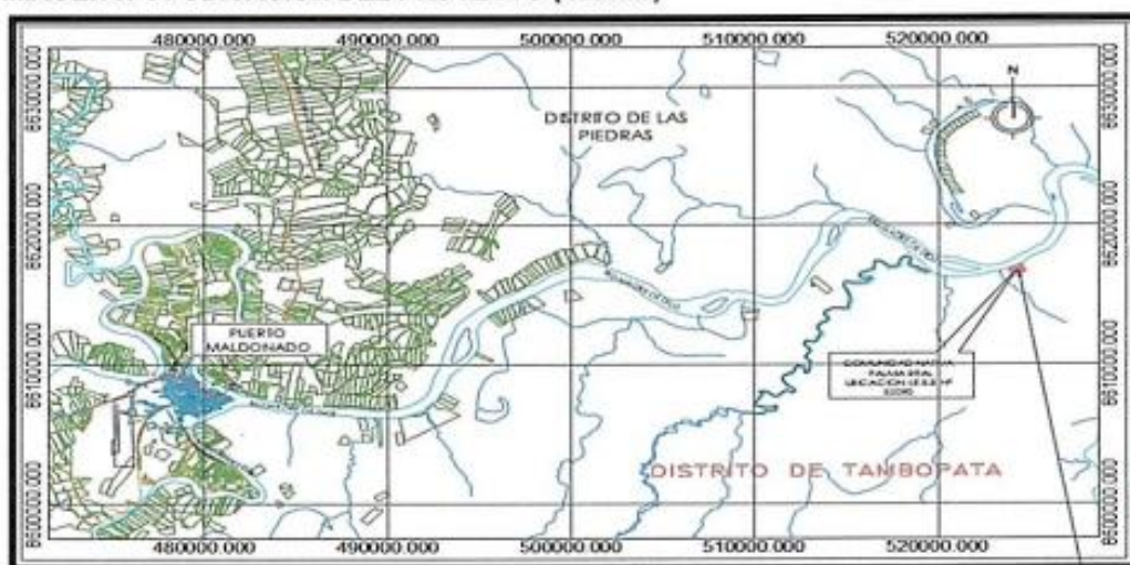
IMAGEN N°01 UBICACIÓN DEL PROYECTO (Grafico)