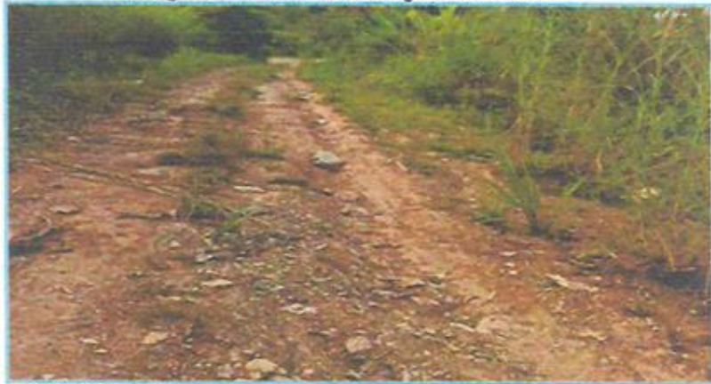
Fotografía N° 01: Pérdida de grava de la vía