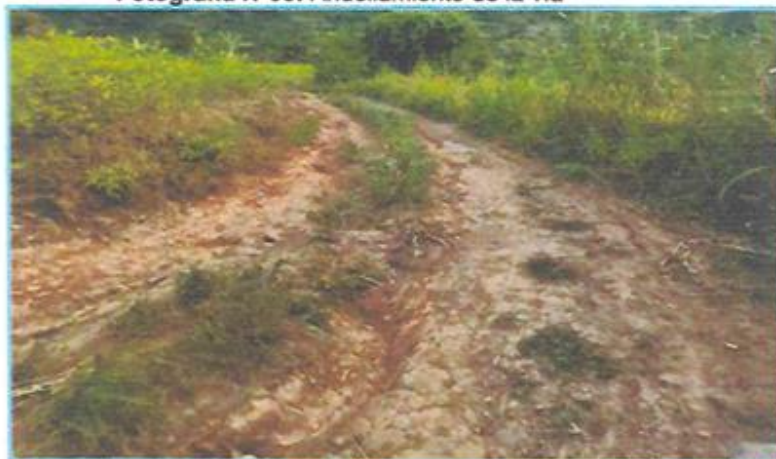
Fotografía N°03: Ahuellamiento de la vía