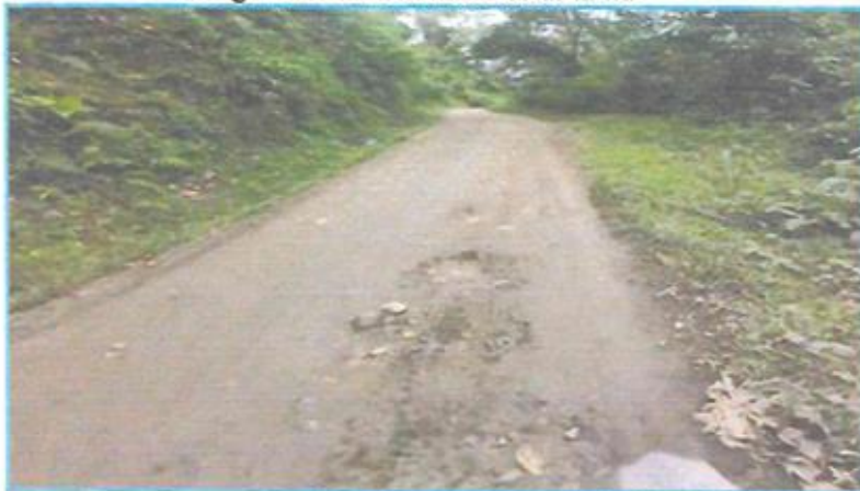
Fotografía N°02: Ondulaciones de la vía

presentan débil cohesión. Este problema persiste en la vía de estudio, tal como se muestra en la siguiente fotografía.