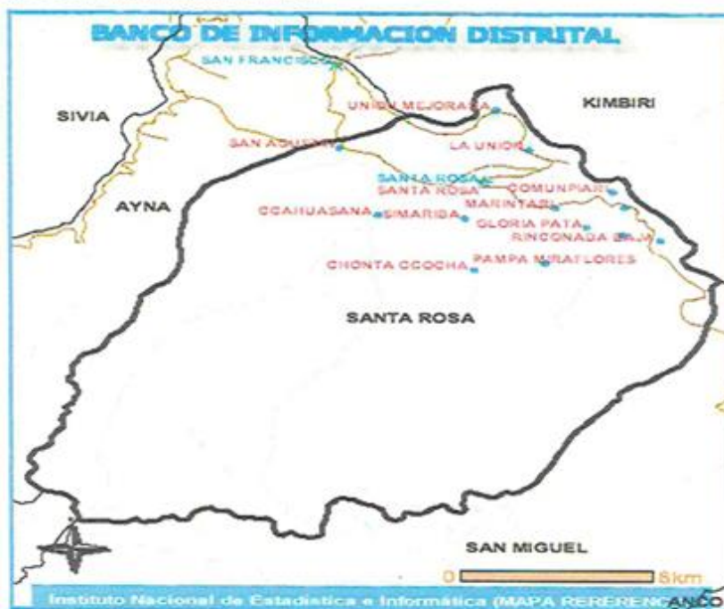
Imagen N°01: Ubicación del Tramo La Actividad