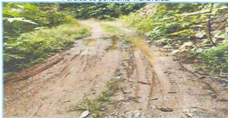
Fotografía N°04: Pérdida de pendiente transversal y ahuellamiento Pérdida de pendiente Transversal

El problema que genera este tipo de deterioro es el estancamiento del agua y en el reblandecimiento del cuerpo de la calzada, los cuales persisten en la vía de estudio.