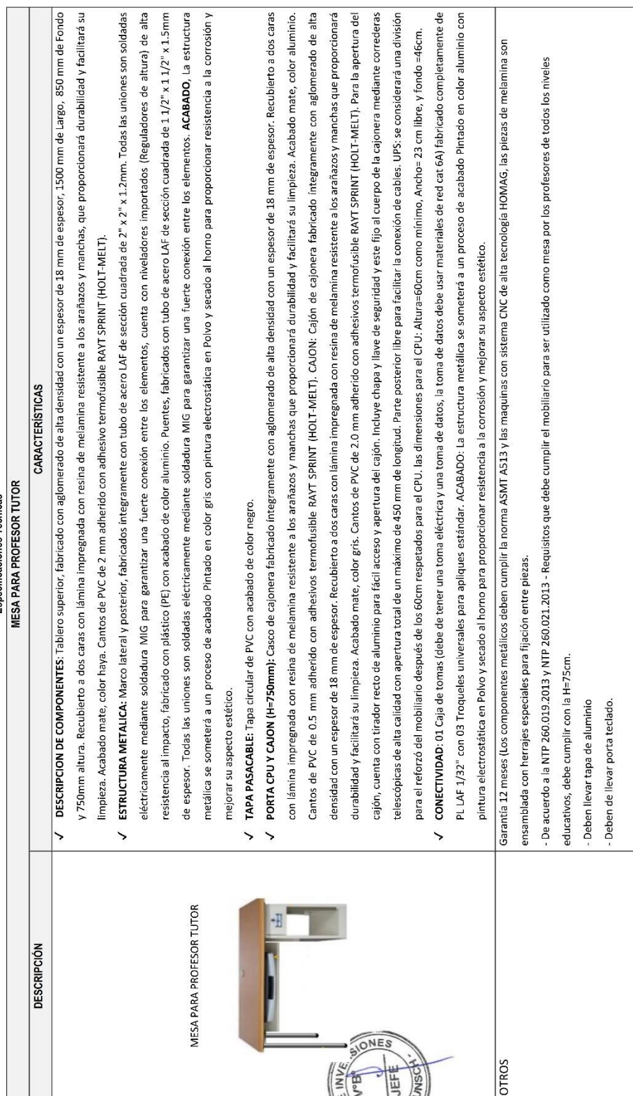
Tabla 02 Especificaciones Técnicas MESA PARA PROFESOR TUTOR

IOARR: Adquisición de Equipo de Laboratorio y Equipo de Aula, en el(la) Escuela Profesional de Ingeniería de Sistemas de la UNSCH distrito de Ayacucho, provincia Huamanga, departamento Ayacucho – II Etapa. CUI N°2515759