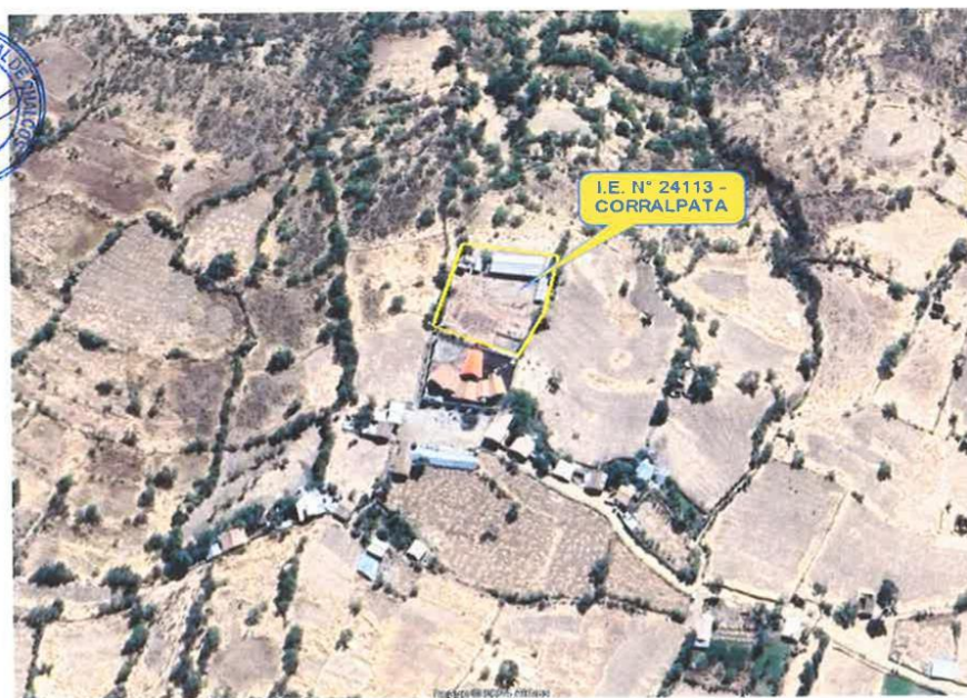
MICROLOCALIZACION DEL PROYECTO - UBICACIÓN DE LA I.E

Un Gobierno juntos por el desarrollo...!!!